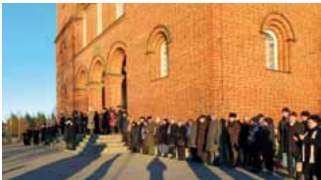
Yleisöä seuraamassa sepeeelnaskua.