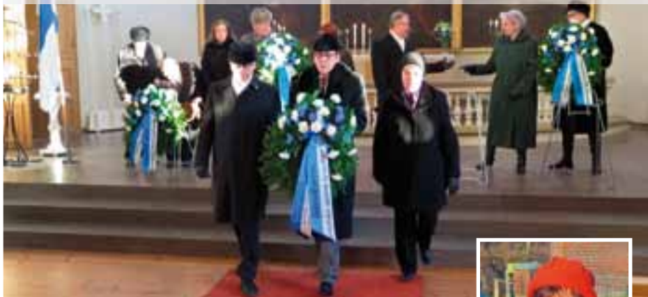
Seppelartio lähdössä kirkosta.