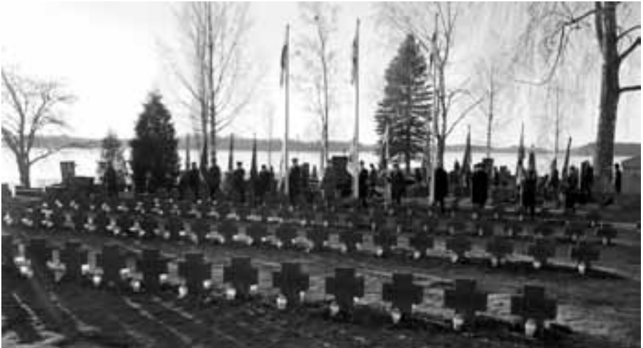
Lippulinna sankarihaudalla itsenäisyyspäivänä 6.12.2016.