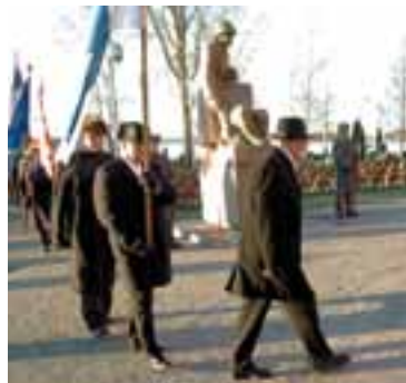
Liput poistumassa sankarihaudalta.