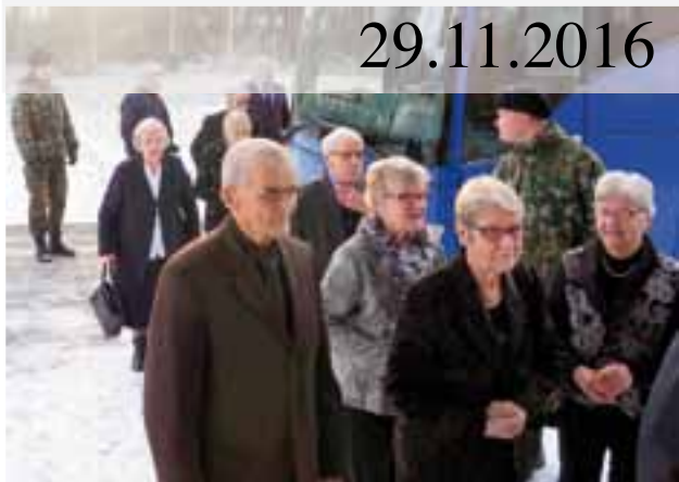
Sastamalan ja Mouhijärven yhdistyksen osanottajat saapumassa.