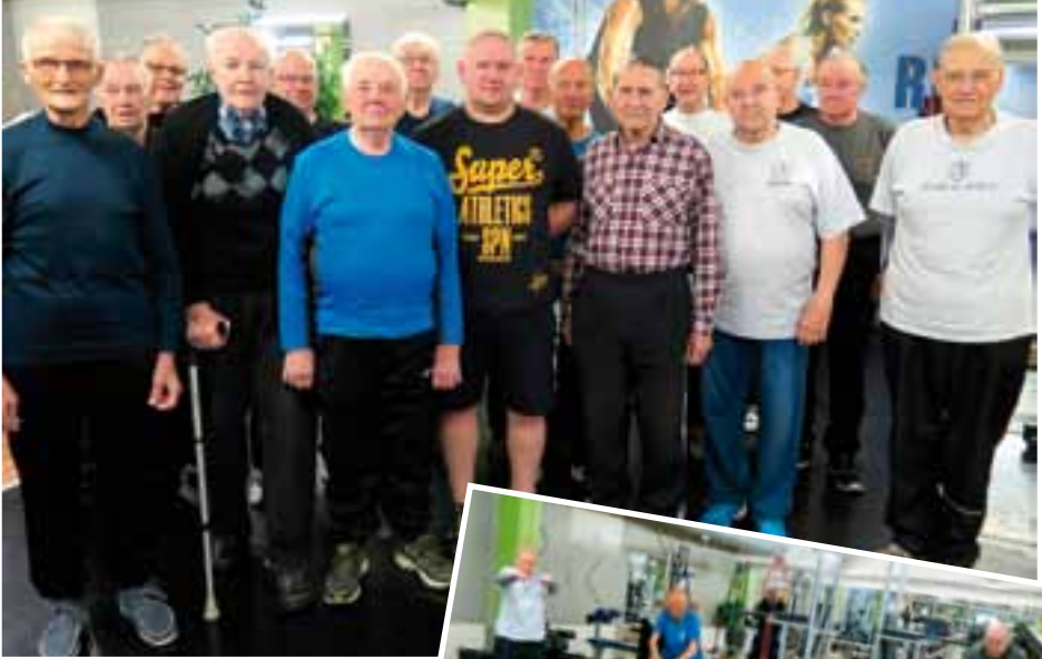
Syksyn kuntopiiriin osallistujia.

Lämmittelyä ja venyttelyä ennen tositoimia.