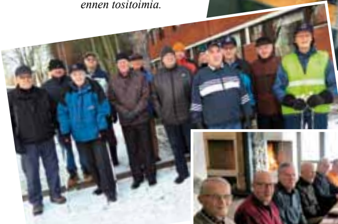
Lenkillä Ellivuoressa ennen pikkujoulua.

Hetki kuvaukselle joululaulujen välissä.