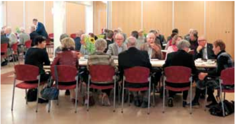
Päivän antiin kuului myös ruokailua ja kahvitusta. Suuren joukon tarjoiluista suoritettiin mallikkaasti Sastamalan yhdistyksen naiset.