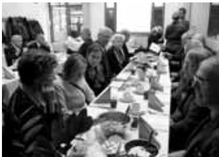
Muohijärven ja Sastamalan yhdistyksen jäseniä veteraanien joululounaalla Satakunnan Lennostossa.