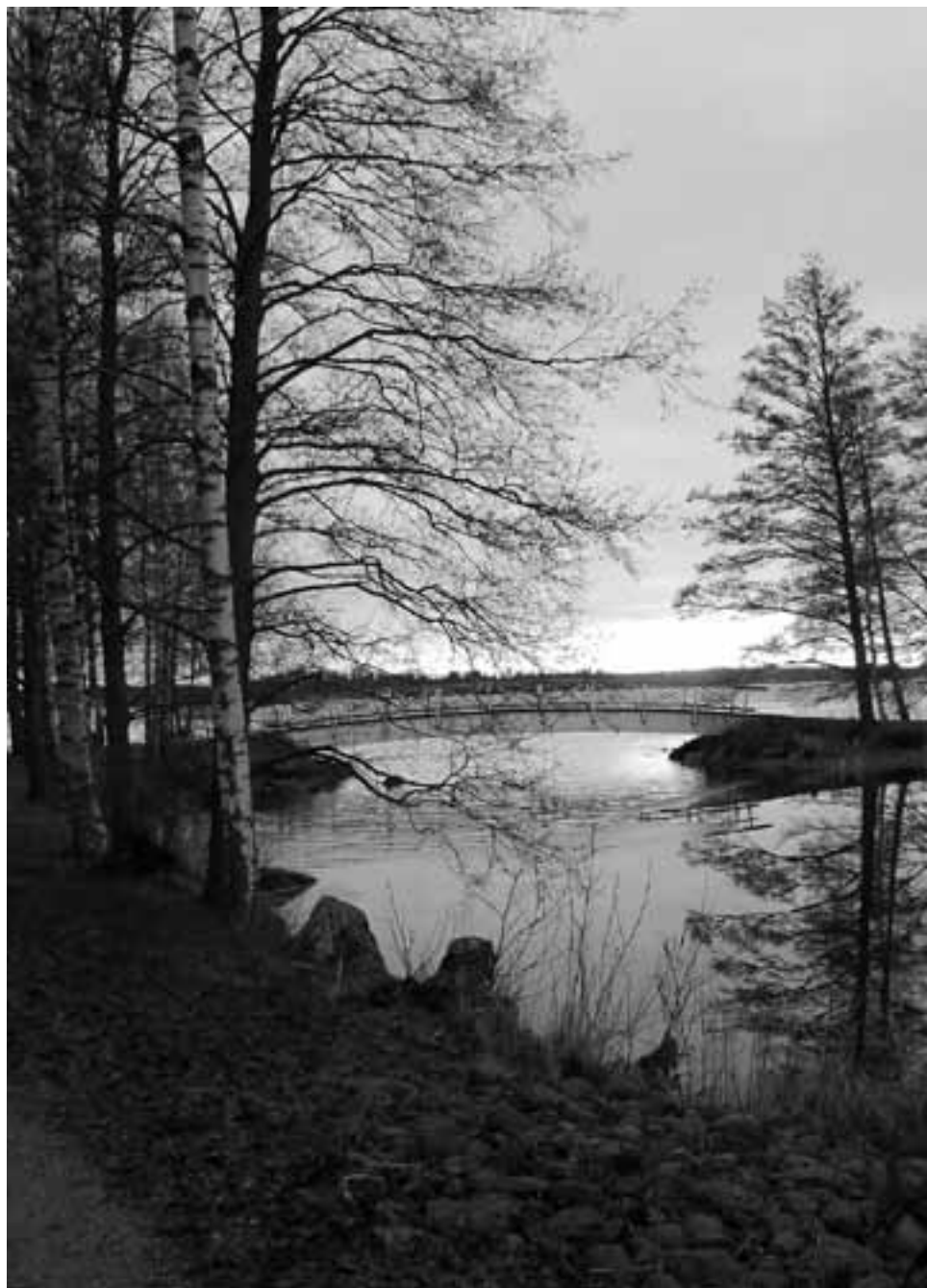
Auringonlasku Liekovedellä.