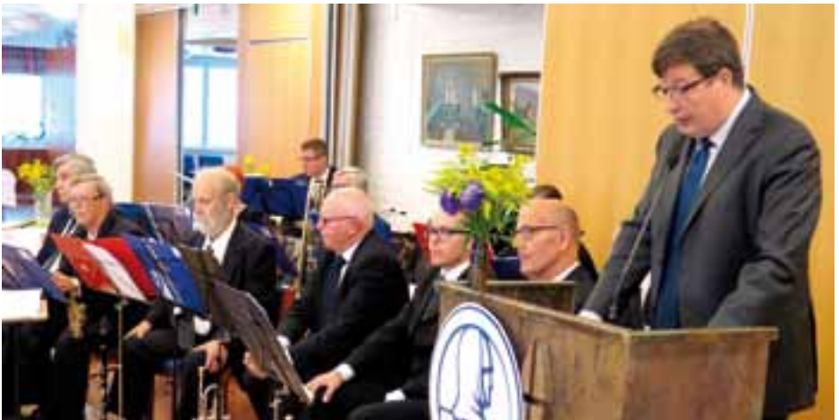
Kansanedustaja Arto Satonen puhui juhlassa.